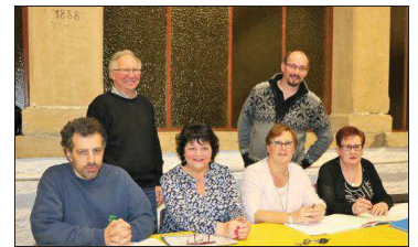
Retonfeys Loisirs et Culture a tenu son assemblée générale.

L'association Retonfeys Loisirs et Culture a tenu son assemblée générale au foyer, place du Gué. Cette année, l'association compte 89 adhérents. Le club jeux Les Aventuriers de Retonfeys qui était réservé aux enfants, a augmenté le nombre de ses adhérents en créant une nouvelle section ouverte aux ados et adultes. Une nouveauté également cette saison : l'activité informatique adulte ouvre ses portes.