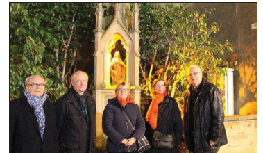
L'oratoire a été mis en valeur.

Le Club Zonta participe à la campagne internationale « Zonta dit non » aux violences faites aux femmes, jusqu'au 10 décembre. L'objectif est « d'orange » un voire plusieurs bâtiments des villes. Une couleur orange choisie en 2012 par l'ONU. Marly a répondu favorablement à cette initiative et c'est l'oratoire consacré à Marie, situé près de l'église, sur le chemin