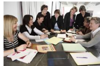
Groupe de travail

Ces mêmes professionnels pourront également analyser les CV et/ou lettres de motivation avec en parallèle l'analyse des offres d'emploi correspondantes.