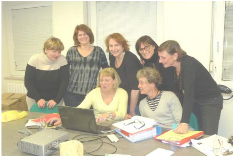
Zontiennes de Metz au travail.